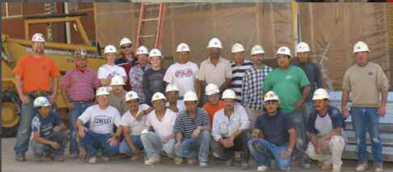
Productivity goals drive this proud Odom Construction Systems crew.